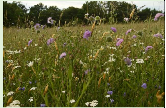
Blütenreiche Mähwiese.